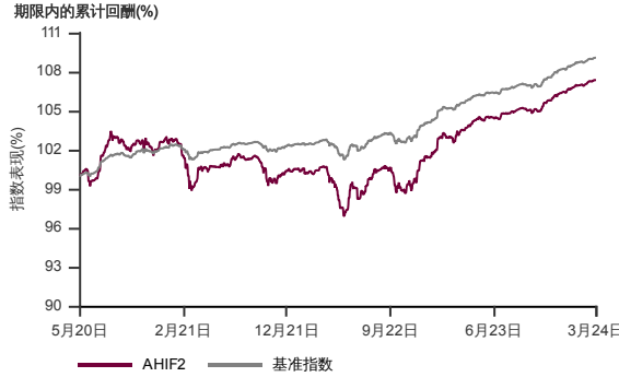
表现指标图截至2024年3月29日*

2017年10月至2024年3月 净资产值 - 净资产价格和假设收入再投资到基金, 其总投资是以马币为基础。基金价格和收益(视情形而定)随时波动 过去表现不应视为未来表现的准则。