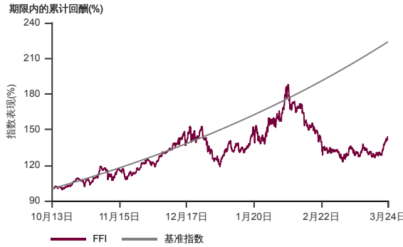
表现指标图截至2024年3月29日*

2013年10月至2024年3月 净资产值 - 净资产价格和假设收入再投资到基金, 其总投资是以马币为基础。基金价格和收益(视情形而定)随时波动 过去表现不应视为未来表现的准则。